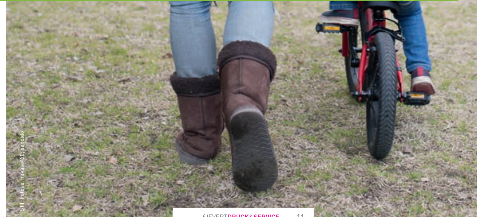
ST1: Fotolia, hakase420, senoldo